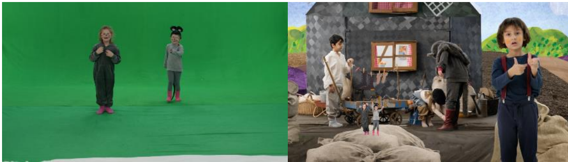
Links: Aufnahme der Mäuse vor dem Greenscreen. Rechts: Die geschrumpften Mäuse im Film

Achtet auf die Erzählerin, den Kutscher oder die Mäuse: Sie haben unterschiedliche Größen - wie geht das?